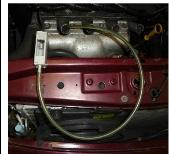
zet zuiger in BDP