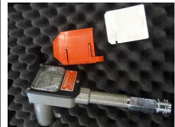
meter, kaarthouder, kaart