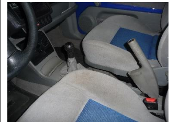
instrueer degene die start