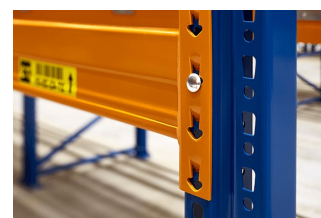
legger geborgd aan staander